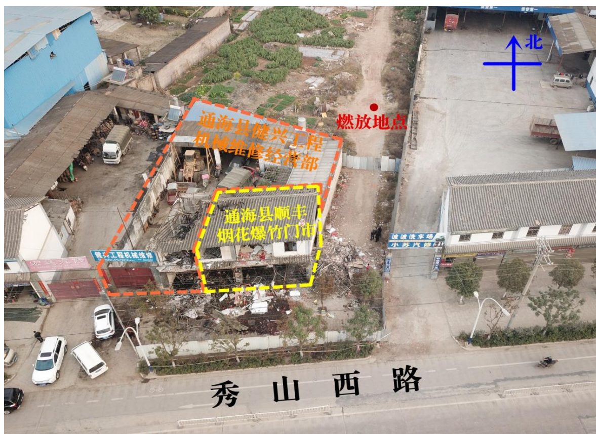
图 1 事故现场航拍示意图

事故发生时，通海县健兴工程机械维修经营部负责人钟某及其亲属一共 5 人在二楼西侧第一间房间内活动。